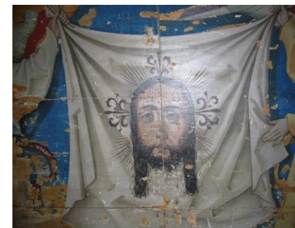
Potni prt sv. Veronike