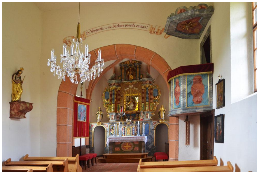
Pogled v cerkev z baročnim oltarjem