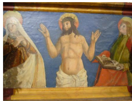
Vstali Kristus, Marija in Janez

Sprednja stran kaže vstalega Kristusa s trnjevo krono in z znamenji ran med Marijo in Janezom Evangelistom.