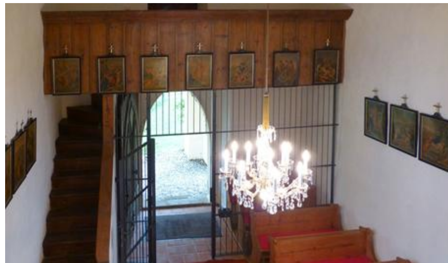
Pogled nazaj – vhod, kor in križev pot

Od prvotne hiše Božje sta se ohranila le ladja in slavolok, ki je izdelan iz klesanih kamnov in ima okrogli lok. Kor, ki je enako širok kakor zdolžna ladja z ravnim stropom, izvira iz časa gotike (15. stol.); ima mrežasto-rebrasti obok na okroglih opornikih.