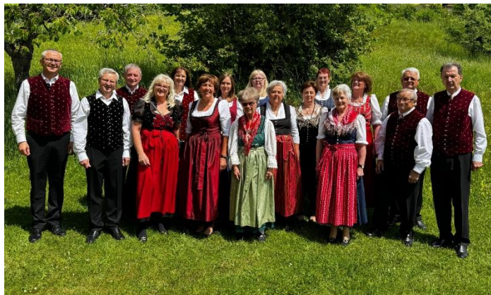
Danke u.a. der Brauchtumsgruppe Waidmannsheil & den Osterschiessern Reifnitz

Der St. Anna Kirchtage verbindet Glauben und Tradition und stärkt den Zusammenhalt in unserer Gemeinde , sodass dieses Fest für viele ein Höhepunkt im kirchlichen Jahreskalender ist.