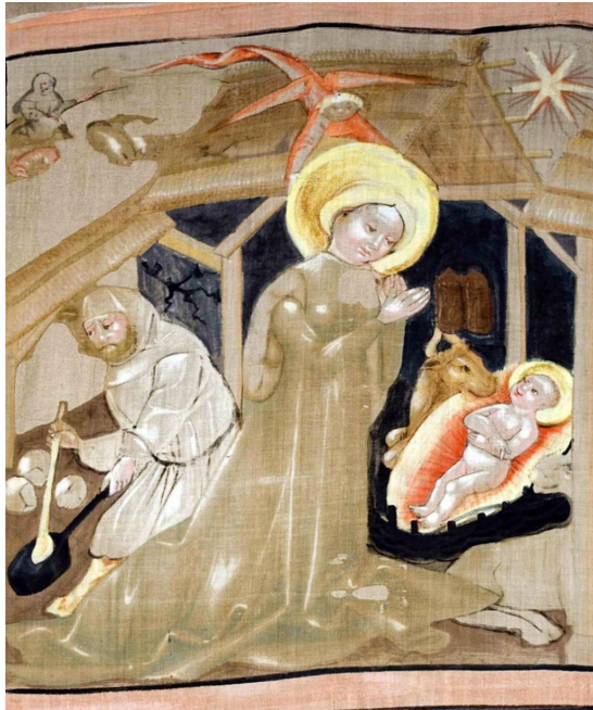
Geburt Christi, Detail aus dem Gurker Fastentuch im Dom zu Gurk

Stimmen wir zur Weihnacht mit Maria in die Freude ein, dass Gott in unsere Welt gekommen ist, und dienen wir wie Josef im neuen Jahr in unseren alltäglichen Kleinigkeiten unseren Mitmenschen und dem, der in die entlegensten Winkel unseres Herzens leuchten will.