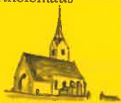
St. Salvator, Hl. Dreifaltigkeit