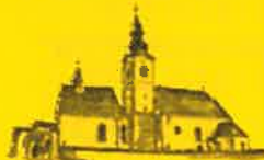
St. Stefan, Hl. Stephanus