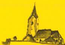
Zienitzen, Hl. Georg