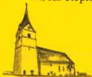
Micheldorf, Hl. Vitus