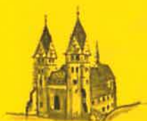
Friesach, Hl. Bartholomäus