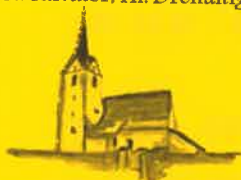
Grafendorf, Hl. Jakobus