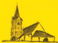
Hohenfeld, Hl. Radegundis