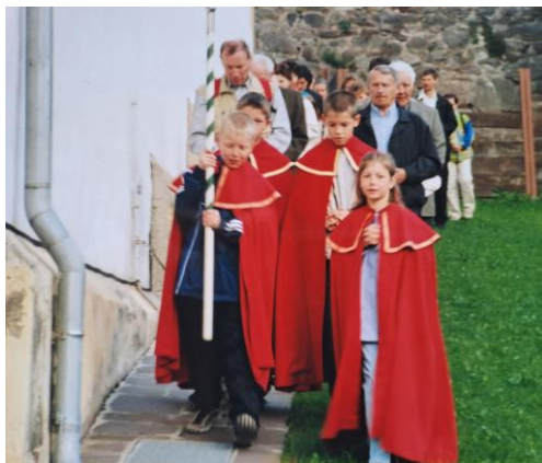
Die Irschner Wallfahrer beim Umschreiten unserer Kirche

Wenn am Pfingstsamstag um 6 Uhr in der in der Früh alle Glocken der Winklerner Pfarrkirche läuten, weiß man: „Die Irschner sind da.“ Der Ursprung dieser Wallfahrt geht auf das Jahr 1669 zurück. Damals wurde das Drautal furchtbar von der Pest heimgesucht und das Gelöbnis abgegeben, eine jährliche Wallfahrt nach Heiligenblut durchzuführen. Bis auf ganz wenige Ausnahmen (u.a. im 2. Weltkrieg) wurde diese Gelöbniswallfahrt immer eingehalten und bis 1964 zu Fuß gegangen. Seit damals hält der Bus beim Winklerner Spielplatz und betend wird zuerst zur und dann um unsere Pfarrkirche herum gegangen. Dann findet traditionell die Heilig-Geist-Andacht statt, bevor es zum Frühstück und weiter nach Sagritz, Maria Dornach und Heiligenblut geht. Den Abschluss bildet dann am Nachmittag wieder eine Andacht in der Pfarrkirche Irschen.