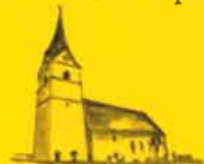
Micheldorf, Hl. Vitus