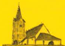
Hohenfeld, Hl. Radegundis