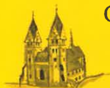
Friesach, Hl. Bartholomäus