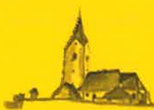
Zienitzen, Hl. Georg