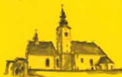
St. Stefan, Hl. Stephanus