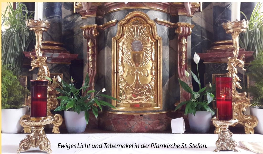
Ewiges Licht und Tabernakel in der Pfarrkirche St. Stefan.

Vor dem Tabernakel, in welchem der Leib Christi aufbewahrt wird, brennt ununterbrochen das ewige Licht, durch welches Christi Gegenwart angezeigt und verehrt wird.