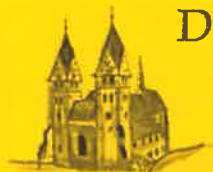
Friesach, Hl. Bartholomäus