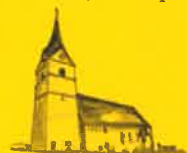
Micheldorf, Hl. Vitus