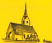
St. Salvator, Hl. Dreifaltigkeit