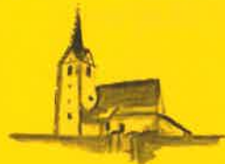
Grafendorf, Hl. Jakobus