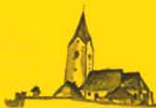
Zienitzen, Hl. Georg