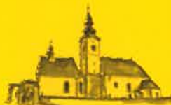
St. Stefan, Hl. Stephanus