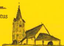
Hohenfeld, Hl. Radegundis