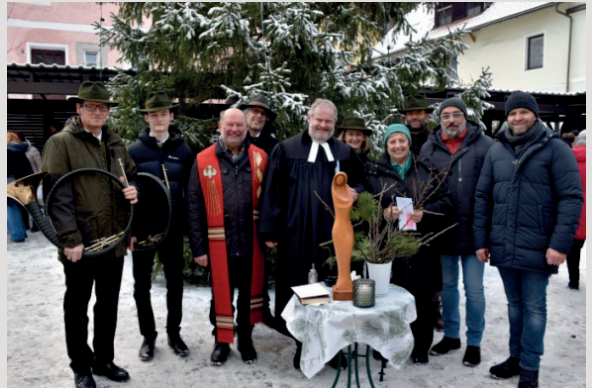
Segnung der Barbarazweige