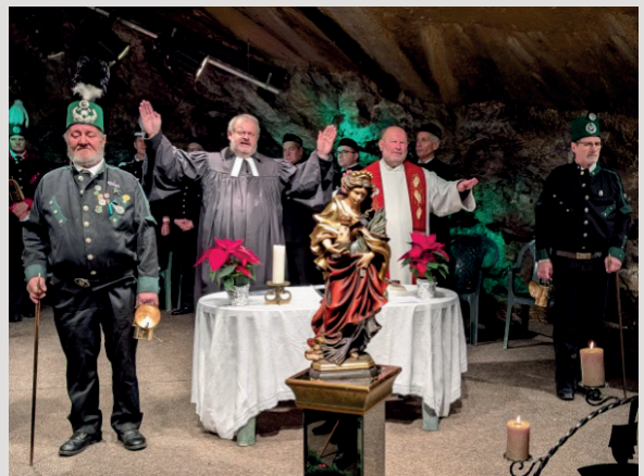
Ökumenischer Barbaragottesdienst in der Perschazsche