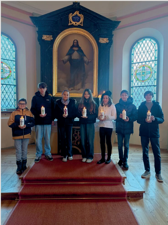
Vorstellung der Konfirmanden 2024/2025