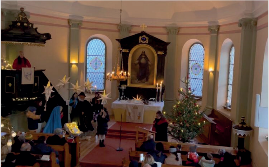
Heiligabend mit Krippenspiel