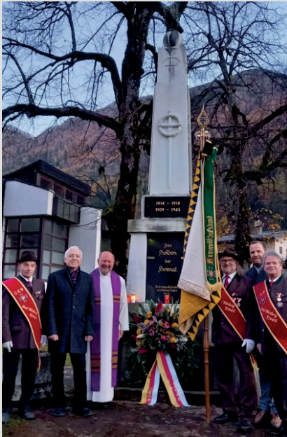
Kranzniederlegung beim Kriegerdenkmal in Bad Bleiberg