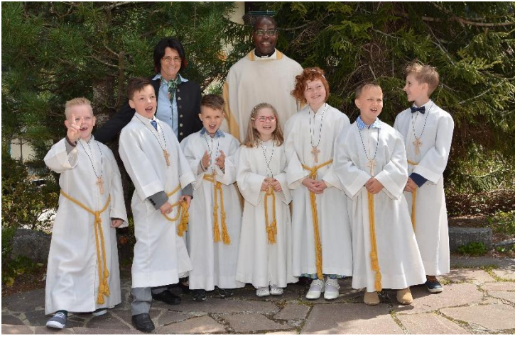
Feier der Hl. Erstkommunion, 2016