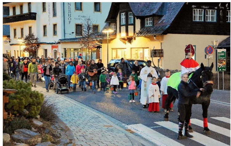
Fest des heiligen Martin mit Umzug durch das Dorf, 2015