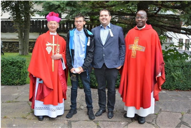
Hl. Firmung mit Prälat Matthias Hribernik, 2020 Hubertusmesse bei der Hubertuskapelle, 2017