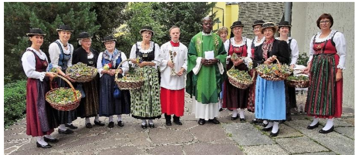
Kräutersegnung mit der Trachtengruppe, 2018 40jähriges Jubiläum der kefb Mallnitz, 2020