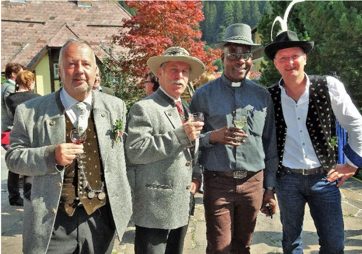
Agape zum Erntedank vor der Kirche, 2020