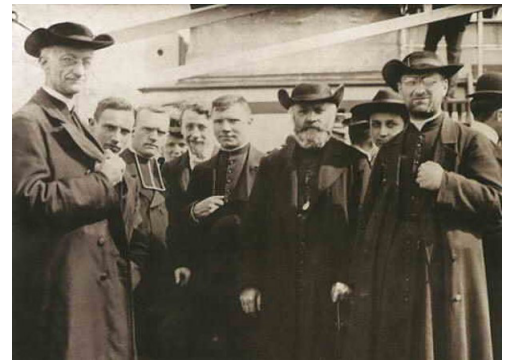
Der Orden wuchs segensreich heran

Evangeliums zu wirken. Pater Dehon, als ein sensibler Mensch und zugleich tüchtiger Priester, fand die Fantasie nicht nur die soziale Gerechtigkeit zu verkünden, sondern durch verschiedene konkrete Initiativen den Bedürftigen tatkräftig zu helfen.