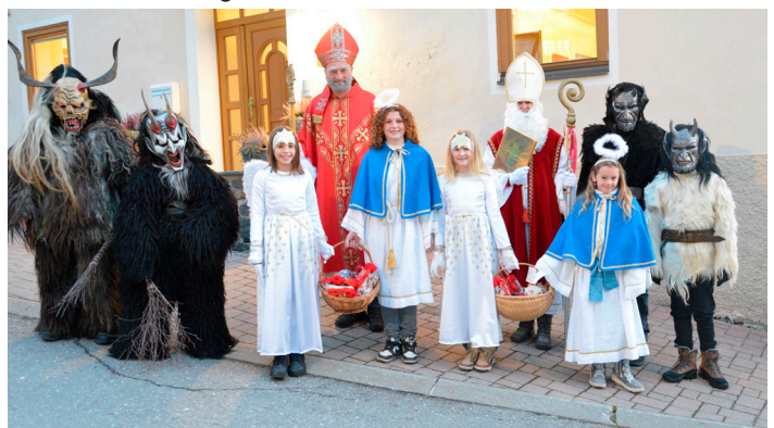
05.12.2024 der Nikolaus war wieder bei Kindern und älteren Pfarrmitgliedern

...und es gäbe noch so vieles zu berichten ...