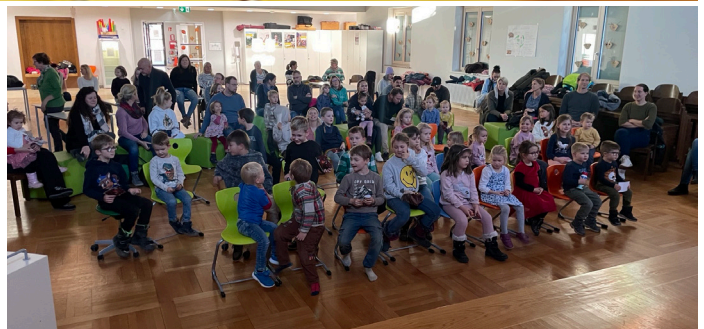
04.12.2024 Kasperltheater in der Volksschule mit vielen begeisterten Kindern