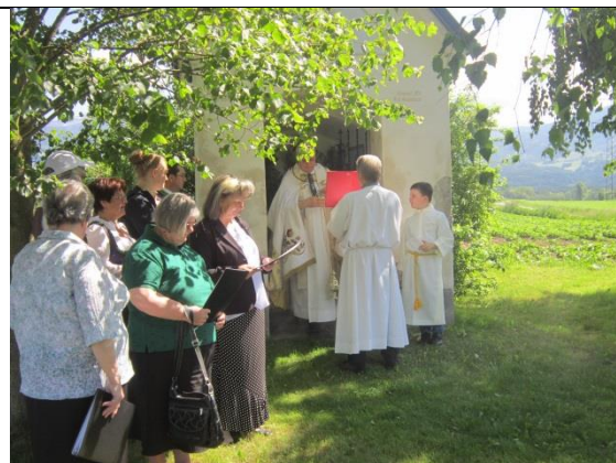
Der Kirchenchor Maria Rojach beim Neuhofer-Kreuz