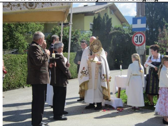
Pfarrer mit Monstranz u. Himmelträger