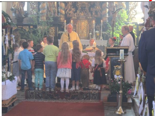
Festmesse, Kinder beim Vaterunser