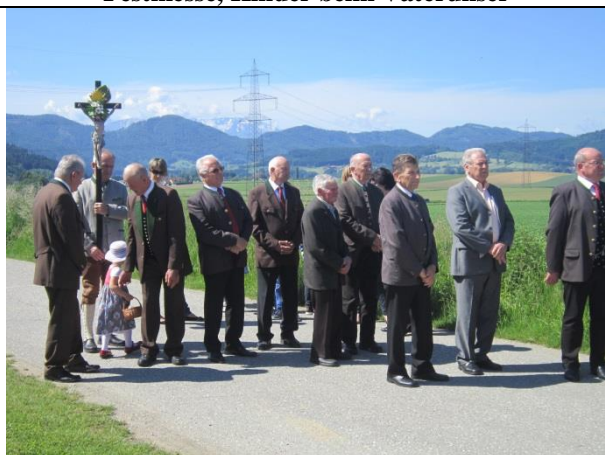
Kreuzträger u. Männer