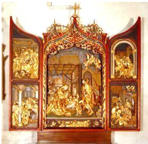
Spätgotischer Flügelaltar Ma. Rojach

10. Juni Lange Nacht der Kirchen 9. Juli Pfarrwallfahrt Stift Heiligenkreuz, Ferien - Urlaubszeit. 24. Juli Anna-Sonntag u. Christophorus-So, 7. August 32 Jahre Kapelle Pontnig, Pontniger Kirchtag, 14. August Laurentius-Kirchtag in Gemmersdorf, 15. August Patroziniumsfest, Maria Himmelfahrt, 21. August 10.30 Bartholomäus-So in Gemmersd. August: Caritas-Sammlung, Bericht: Erstkommunionfeier 2016, 11. Sept. Sterzfest in Gemmersdorf, 18. Sept. 100 Jahre Felsabsturz Gemmersdorf, 25. Sept. Erntedankfest und Pfarrfest