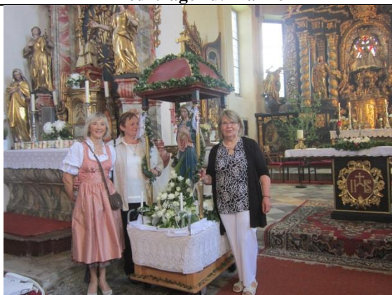
Die Kath. Frauenbewegung übernahm das Schmücken des Frauenbildes und das Schmücken der Kirche