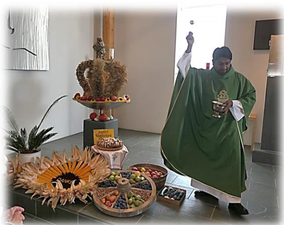
Erntedankfest