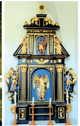
Der Schutzengel-Altar in der Kirche St. Nikolai