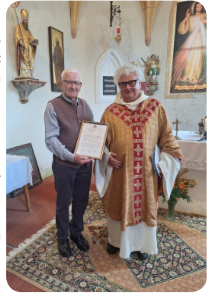
Geburtstagsgeschenk der Pfarrgemeinde St. Ulrich für Herrn Pfarrer

Im September 2023 hat es im Dekanat Kappel am Krappfeld einen großen Pristerwechsel gegeben und unser Herr Pfarrer muss jetzt 7 Pfarren betreuen. In St. Ulrich feiern wir am dritten Sonntag im Monat (mit Ausnahmen), um 11.30 Uhr die Hl. Messe.