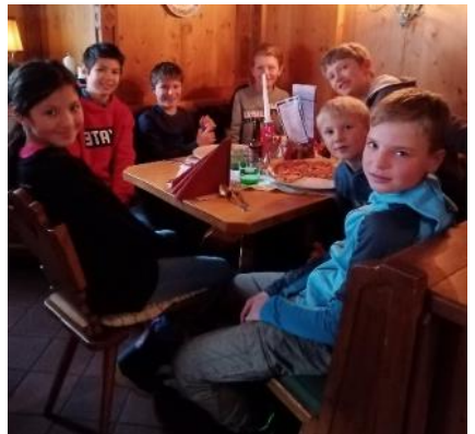
22.12.2024 Trattlers Einkehr