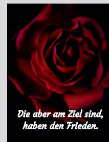
Die aber am Ziel sind, haben den Frieden.