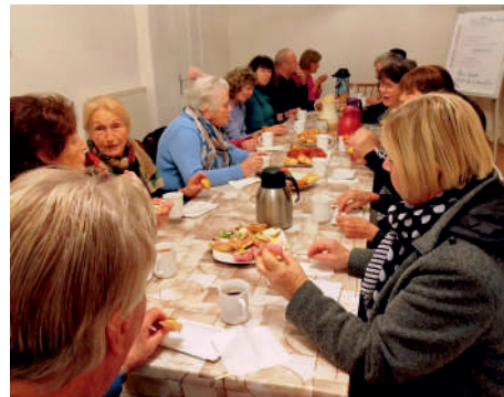
Stärkung nach der Rorate-Messe