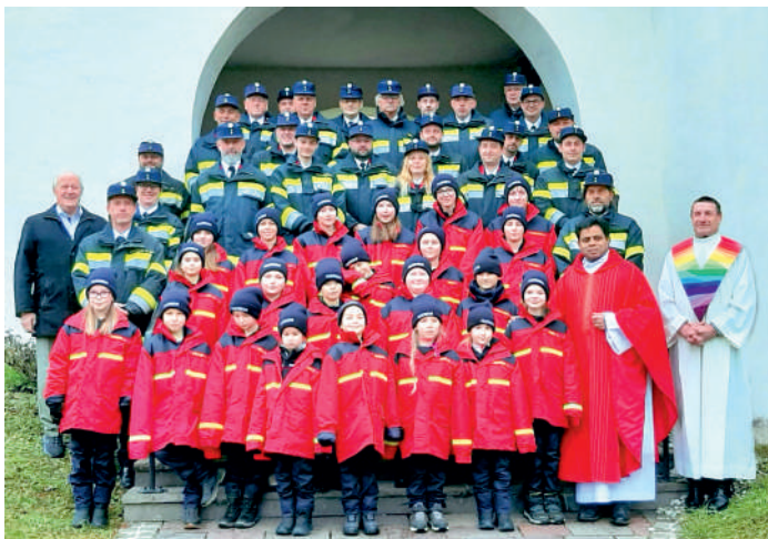
Die Kameradinnen und Kameraden mit der Kinder- und Jugendgruppe der FF Keutschach vor der Pfarrkirche