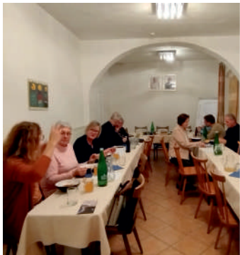
Treffen der Vertreter des Dekanates Klagenfurt-Land im Pfarrhof