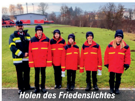
Holen des Friedenslichtes