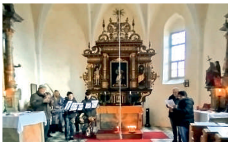
Stimmige Adventandacht in St. Margarethen mit der „Musikbanda Fundis“