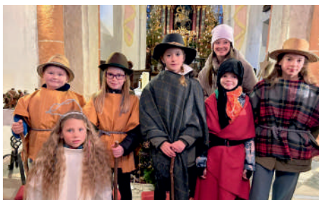
Krippenspiel am Nachmittag des 24. Dezember