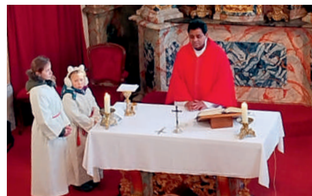
Am Stefanitag wurde die Messe in St. Anna vom „Kirchenchor Keutschach/Cerkveni zbor iz Hodiš“ gesanglich umrahmt.