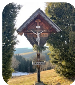
Kötschendorf: 11:15 Uhr: „Sponewirt Kreuz“

19:00 Uhr: Osterfeuer des SVZ in Zammelsberg