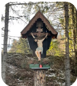
Oberort: 10:00 Uhr „Sabitzer Kreuz“

Schon vorab ein herzliches „Vergelt's Gott“ für die liebevolle Vorbereitung!