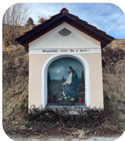
Zammelsberg: 10:15 Uhr „Weißes Kreuz“