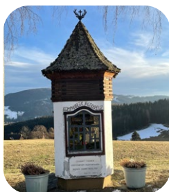
Planitz: 11:00 Uhr „Kompaninger Kreuz“