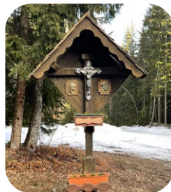
Wullroß, Dolz: 10:30 Uhr „Lenzen Kreuz“