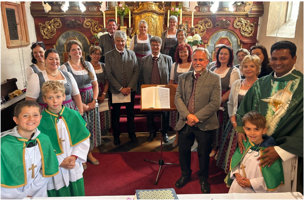
Die Singgemeinschaft Guttaring gestaltete den Gottesdienst am 9. Juni 2024.