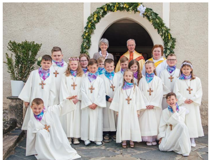
Erstkommunion in Zweikirchen

Ein großer Dank gilt Frau RL Eveline Hlavka für die Gesamtorganisation, die Vorbereitung in den Religionsstunden und der liturgischen Texte. 14 Kinder haben das erste Mal das Heilige Brot empfangen dürfen - der Segen unseres Gottes möge immer an ihrer Seite sein!