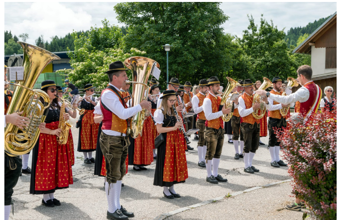
MV Glantal – Pfarrfest Glantschach