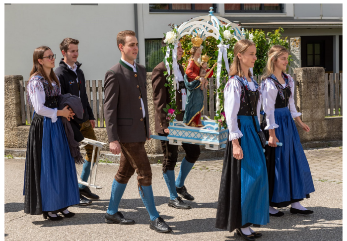
Pfarrfest Glantschach