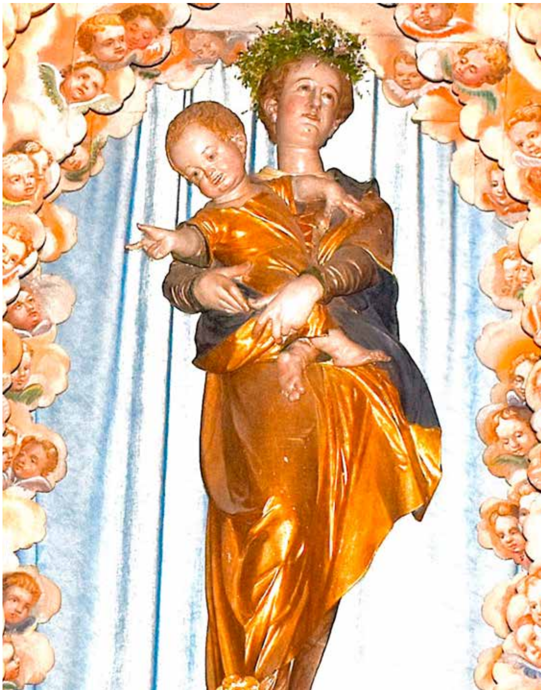
Muttergottes von Engeln umgeben, Hochaltar Maria Bichl