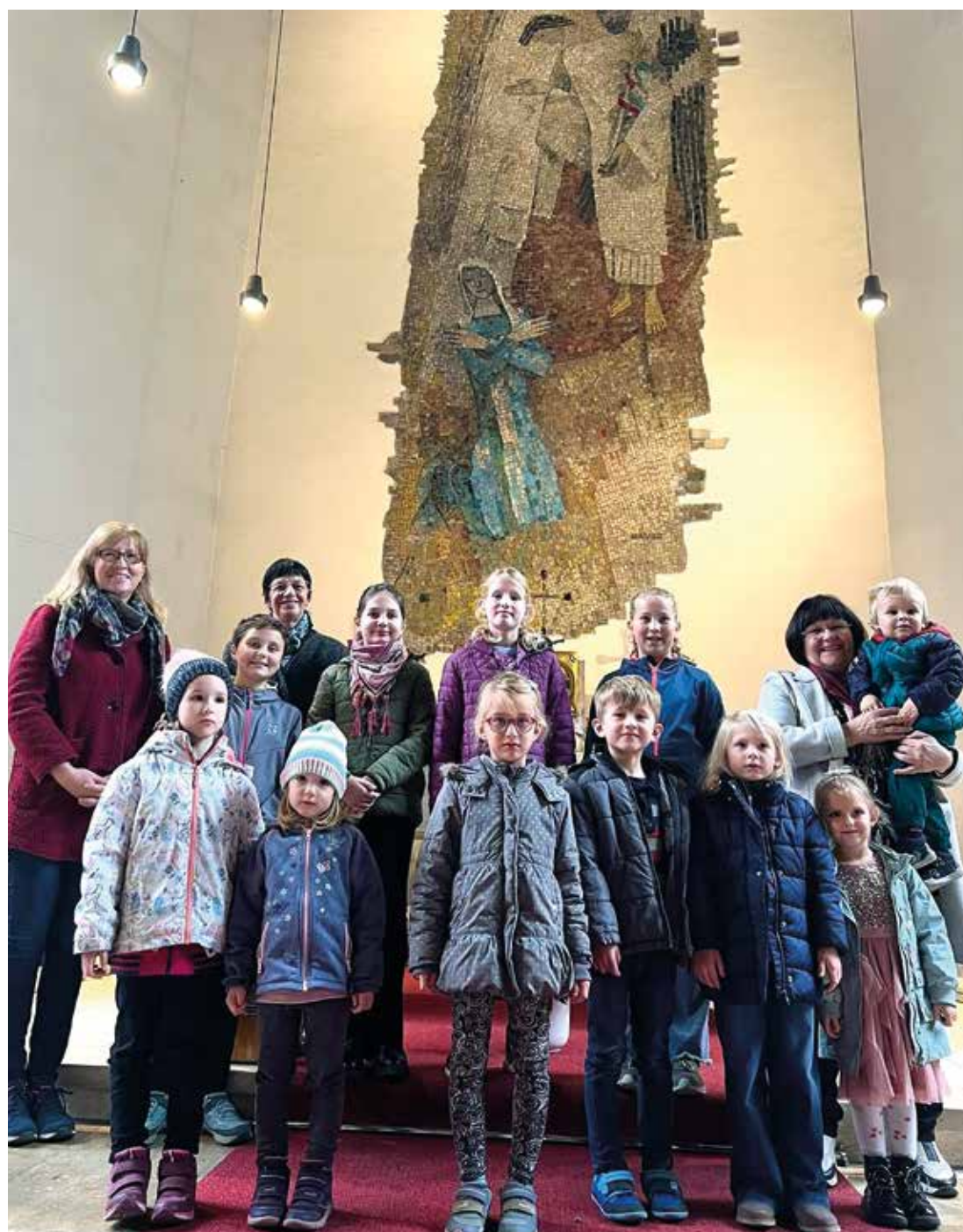
Kinderchor mit den Begleiterinnen