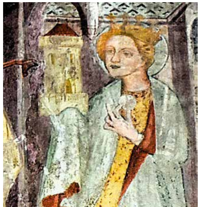
Hl. Barbara - Fresko über der Eingangstür der Kirche St. Peter in Holz (15.Jh.)