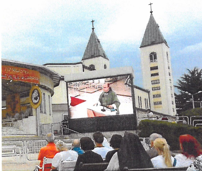
Marienwallfahrtsort Medjugorje, Gebetsstätte und Kirche St. Jakobus.