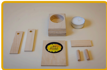
Sesatavine darovalca luči