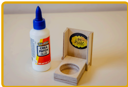
Danach klebt ihr mit dem Bastelkleber den Deckel auf die seitlichen Blättchen