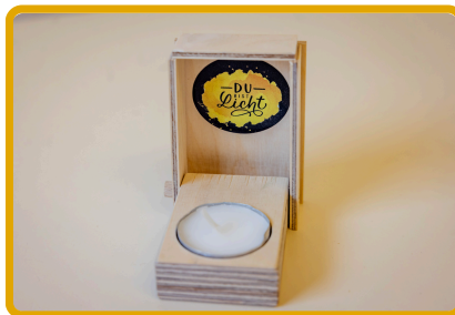
Nun klebt ihr das kurze Blättchen auf den Deckel und die seitlichen Blättchen - und fertig ist euer Lichtspender!