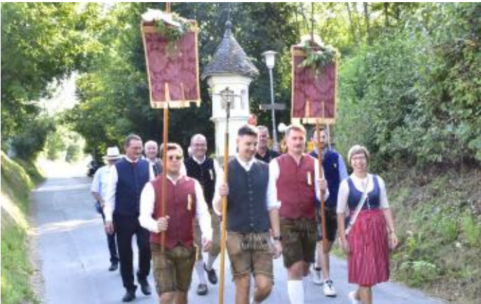
Ein großer Dank geht an die Himmelträger, die TrägerInnen der Mariensäufte sowie dem Kreuz und an die Landjugend, die wieder die Fahnen getragen hat

Zu Ehren des hl. Jakobus des Älteren haben wir auch heuer wieder Jakobi- und Schützenkirchtag gefeiert.