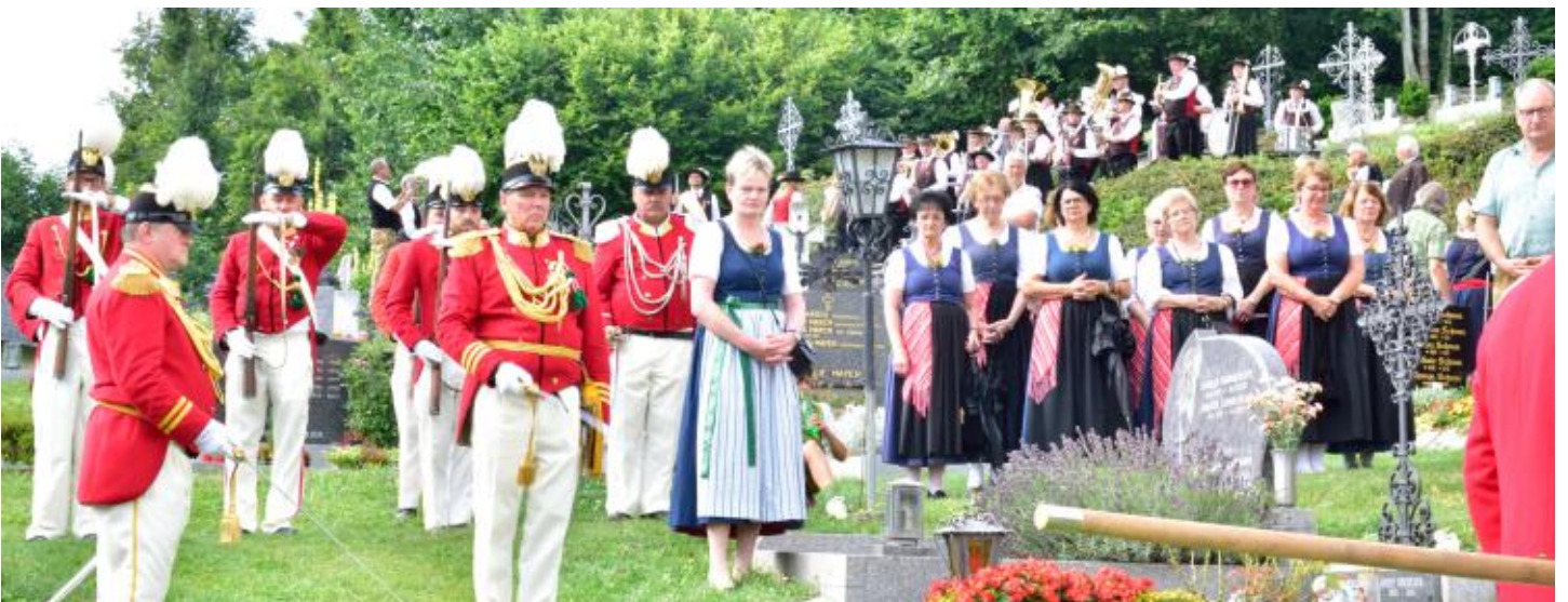
Schützenkapelle, Trachtenfrauen, Trachtenkapelle und die Pfarrgemeinde beim Gedenken an die Opfer der Weltkriege