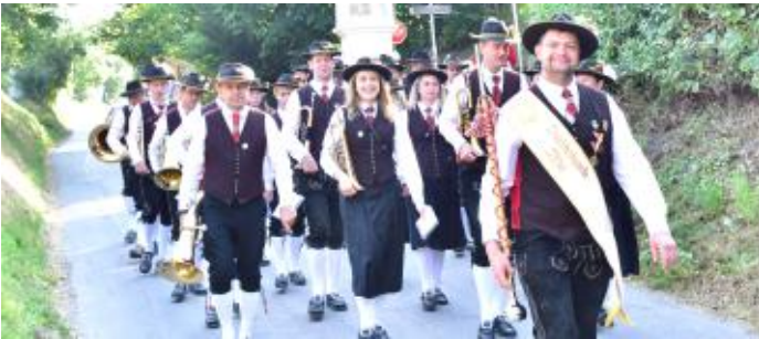
Die Trachtenkapelle Tiffen bei der Prozession