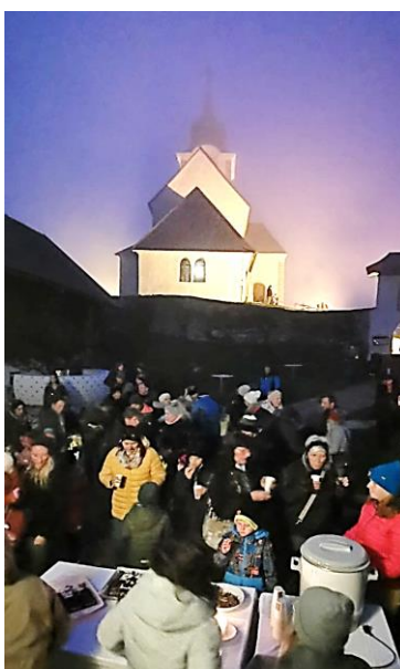
Martinsfeier am Sternberg am 10. Nov. 2024