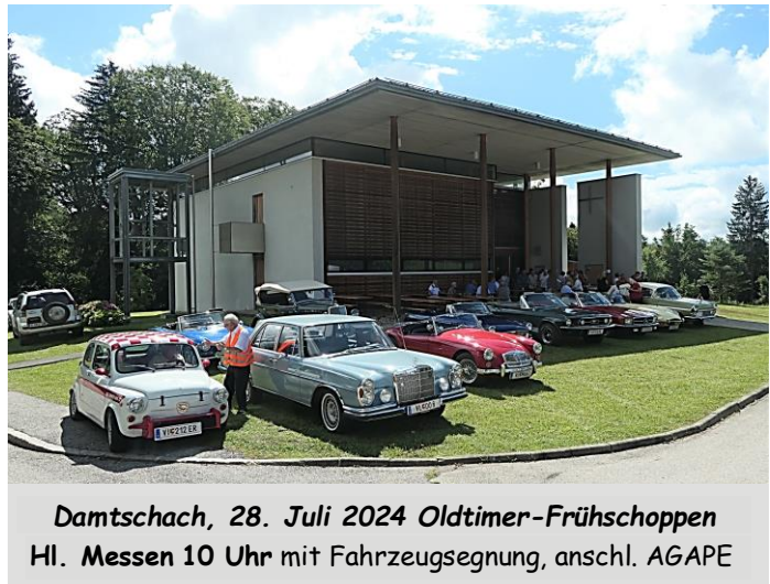
Damtschach, 28. Juli 2024 Oldtimer-Frühsschoppen Hl. Messen 10 Uhr mit Fahrzeugsegnung, anschl. AGAPE