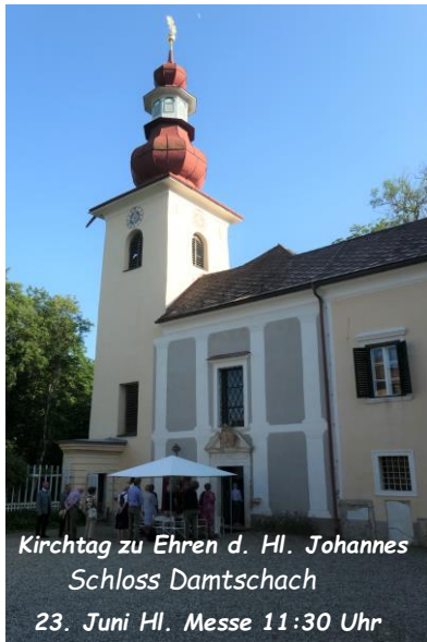
Kirchtag zu Ehren d. Hl. Johannes Schloss Damtschach 23. Juni Hl. Messe 11:30 Uhr

Wir hoffen auf einen schönen Tag und erbitten Gottes Segen für die zahlreichen Pilger!