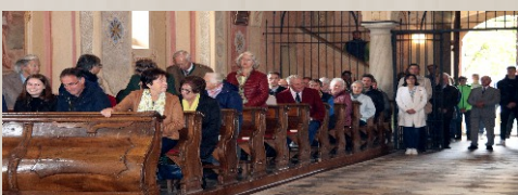
Peter & Paul Seite/stran 6