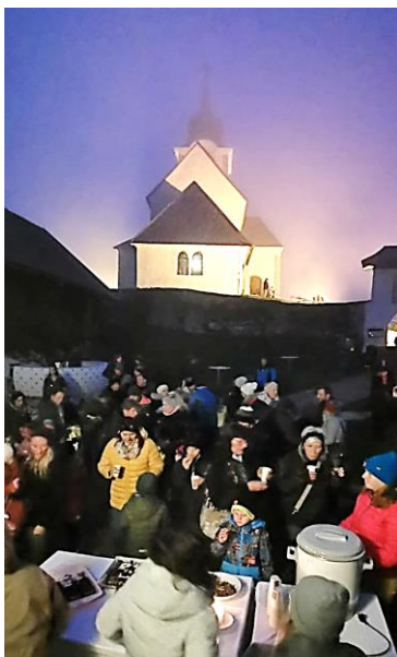
Martinsfeier am Sternberg am 10. Nov. 2024