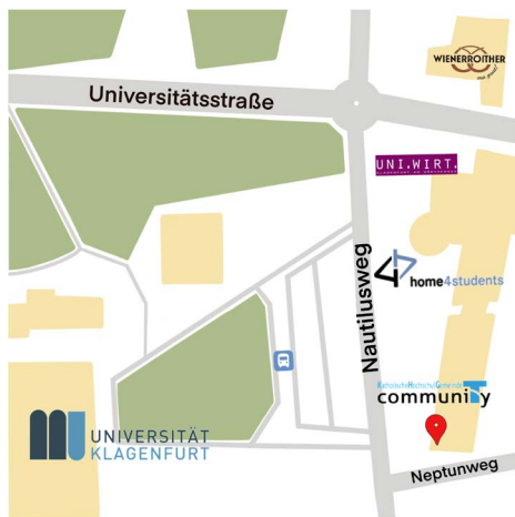
Grafik: Anne Müller