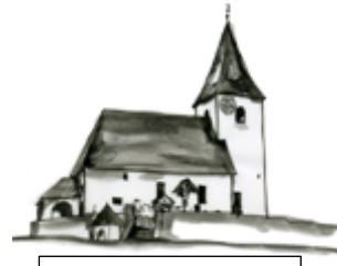
St. Johann am Pressen