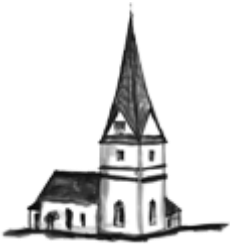
St. Martin am Silberberg