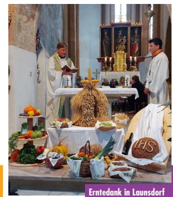
Erntedank in Launsdorf