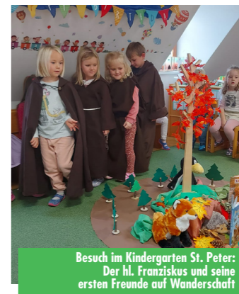
Besuch im Kindergarten St. Peter: Der hl. Franziskus und seine ersten Freunde auf Wanderschaft