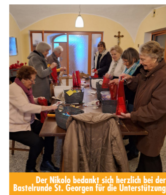
Der Nikola bedankt sich herzlich bei der Bastelrunde St. Georgen für die Unterstützung