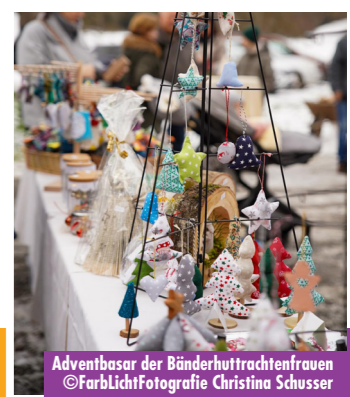
Adventbasar der Bänderhuttrachtenfrauen