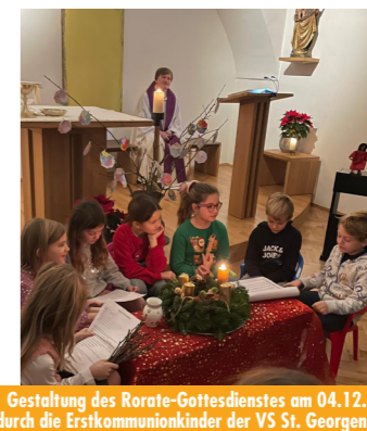
Gestaltung des Rorate-Gottesdienstes am 04.12. durch die Erstkommunionkinder der VS St. Georgen